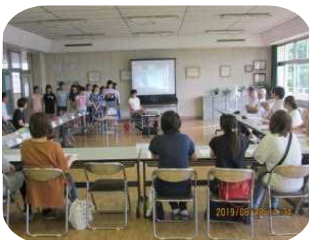
児童保健委員の発表

お子さんが歯科や眼科などの治療勧告を受けている場合は、夏休み中に受診するようご協力ください。