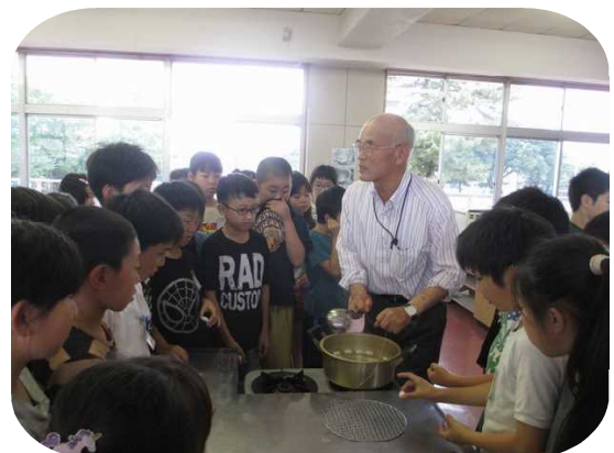
7月11日(木) 4年「校旗を作ろうプロジェクト」

5年生は、総合「守ろう地球環境」の学習で、大気汚染と地球温暖化をテーマに実習をおこないました。講師は理科専門の元校長先生です。4年生は、総合の授業で養蚕指導員を講師に招き、蚕を育てて繭から生糸を取りました。校旗の完成が待ち遠しいですね。