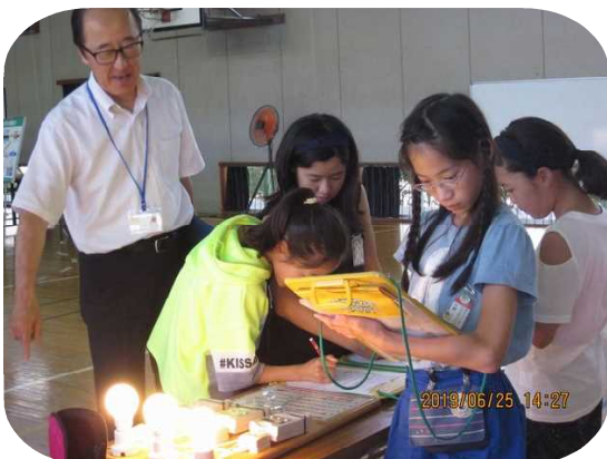
6月25日(火) 5年「動く環境教室」

5年「桐生市情報モラル講習会」は、ぐんま子どもセーフネット活動委員会からインストラクターを講師に招き、6年「人権教育出前講座」は、桐生市教育委員会生涯学習課から担当指導主事を講師に招いて開催し、どちらも授業参観日に親子で学び考える機会にしました。