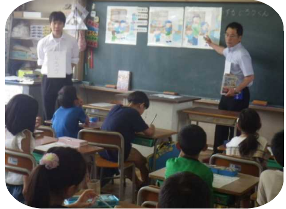
6月19日(水) 3年「万引き防止教室」

1年の音楽科の授業では、楽器会社から鍵盤ハーモニカの講師を招き、ピアノ名人になるための4つの秘密を学びました。また、3年生は、桐生警察署のスクールサポーターから万引き防止の授業を受け、犯罪をしない強い心と行動力を身につけるよう教えて貰いました。