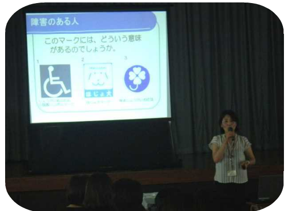
6月19日(水) 6年「人権教育出前講座」

5年「桐生市情報モラル講習会」は、ぐんま子どもセーフネット活動委員会からインストラクターを講師に招き、6年「人権教育出前講座」は、桐生市教育委員会生涯学習課から担当指導主事を講師に招いて開催し、どちらも授業参観日に親子で学び考える機会にしました。