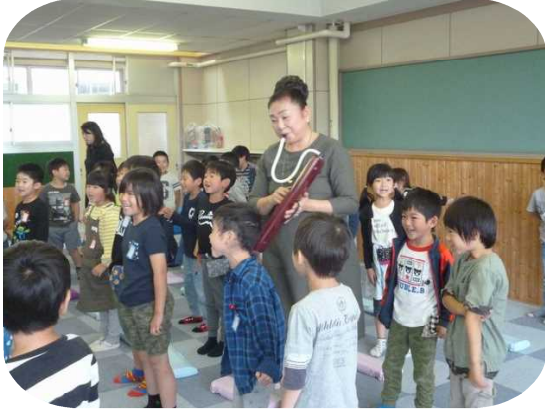
6月11日(火) 1年「鍵盤ハーモニカ講習会」

プロフェッショナルから直接専門的な指導を受けることほど、子どもたちの学びが深まる機会はありません。1学期は、各教科の学習の導入場面や発展学習として多くの講師を招いて講習会や出前講座、教室を実施しました。どの学習でも子どもたちが真剣に話を聞き、目を輝かせて取り組む様子が見られ、有意義な学びの時間になりました。