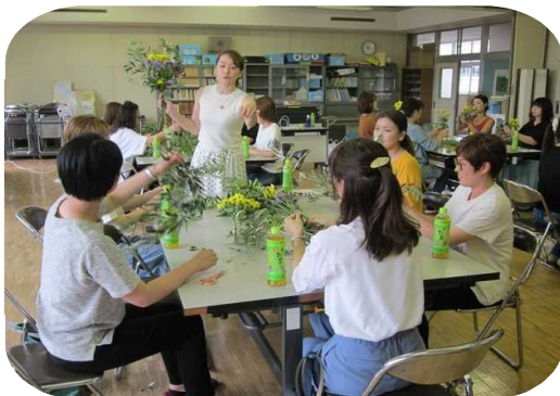
グループになって楽しくスワッグ作り

6月26日(火)にPTA教養委員会が主催する第1回PTA家庭教育学級が開催されました。今回は、大間々町でフラワーアレンジメント教室「アトリエ」を運営しているHANA先生を講師にお招きして「スワッグ作り教室」をおこないました。