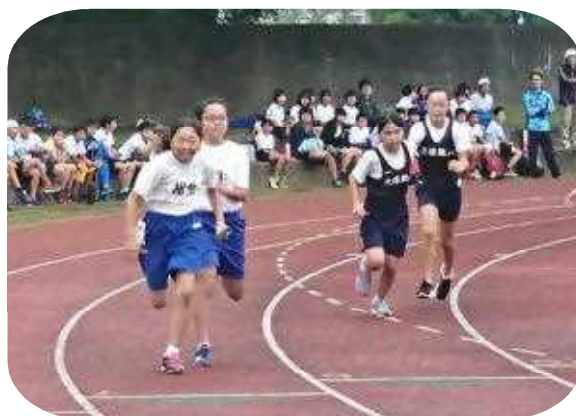
女子4×100mリレー 3走 O・Kさん から 4走 A・Rさんへ

また、今回、雨の影響などで記録が残せない選手もいましたが、それぞれ真剣に練習に取り組み、相生小学校の代表として本記録会に参加したことは、これからの学校生活に必ず生きる力になると思います。