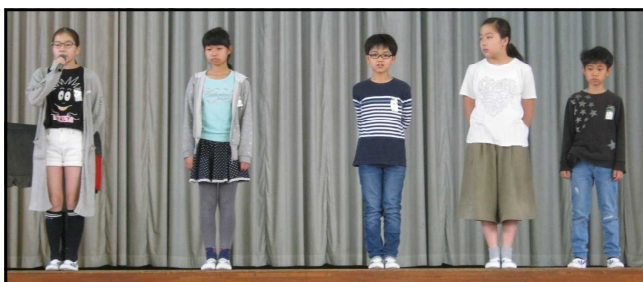
〈児童会本部役員のメンバー〉

本部役員に続いて、各委員会の委員長9名がステージに上がり、就任の抱負と各委員会からのお願いを述べました。